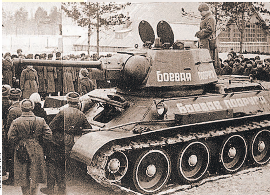
Тот самый танк, построенный на сбережения отважной крымчанки.