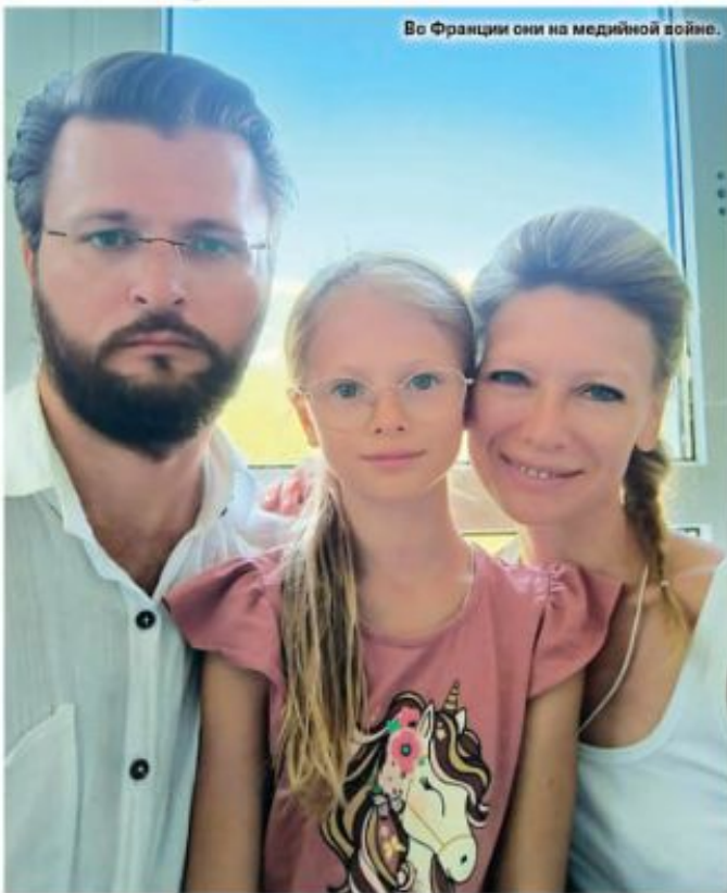
Во Франции они на медийной войне.