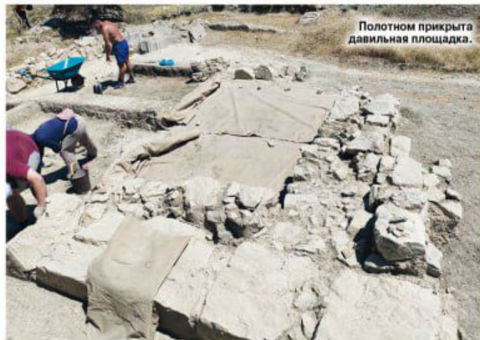
Полотном прикрыта давящая площадка.