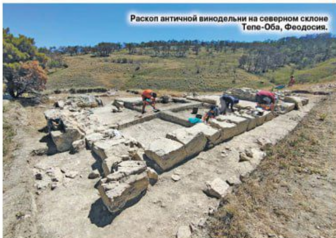
Раскоп античной винодельни на северном склоне Тепе-Оба, Феодосия.

Но ведь на керамике, наверняка, остались следы того вещества, которое наливали в целый пифос, подумает читатель! Технические и научный прогресс дошел до того, чтобы определить хиджость по засохшим