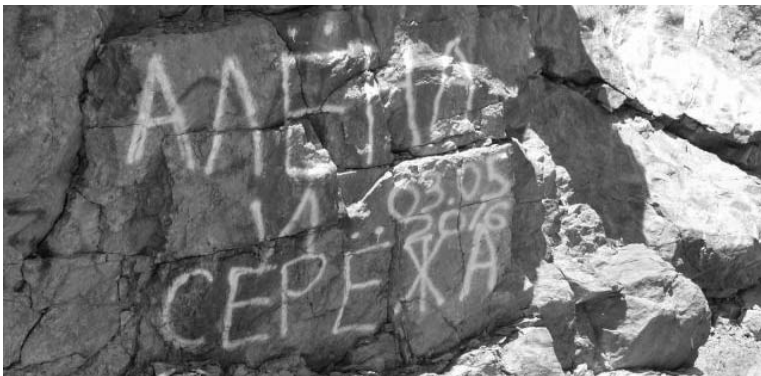
Вот кому греет сердце такая «память»?

всех этих «заяк», «мусиков», «пупсиков». Хотя уголовный кодекс РФ предусматривает за вандализм довольно крупный штраф 40 тысяч рублей. Однако в нём предусмотрено наказание только за порчу такого имущества, как здания. Существует еще одна статья, которая предусматривает трёхмиллионный штраф за уничтожение и повреждение памятника истории и культуры, природного комплекса. И само понятие «природный комплекс» довольно широкое. В законе оно уточняется: «до элементов, составляющих природный ландшафт». То есть, скала вполне подходит под этот элемент. И любого человека, изрисовавшего природное каменное обнажение, можно считать нарушителем. Правда сложно приобщить покраску камня к понятию