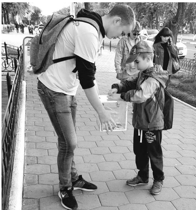
Лжеволонтеры трудятся за процент.

Иногда требуются препараты, не входящие в перечень того, что закупает государство. Случается, что нужны — и срочно, лекарства для лечения сопутствующих забо-