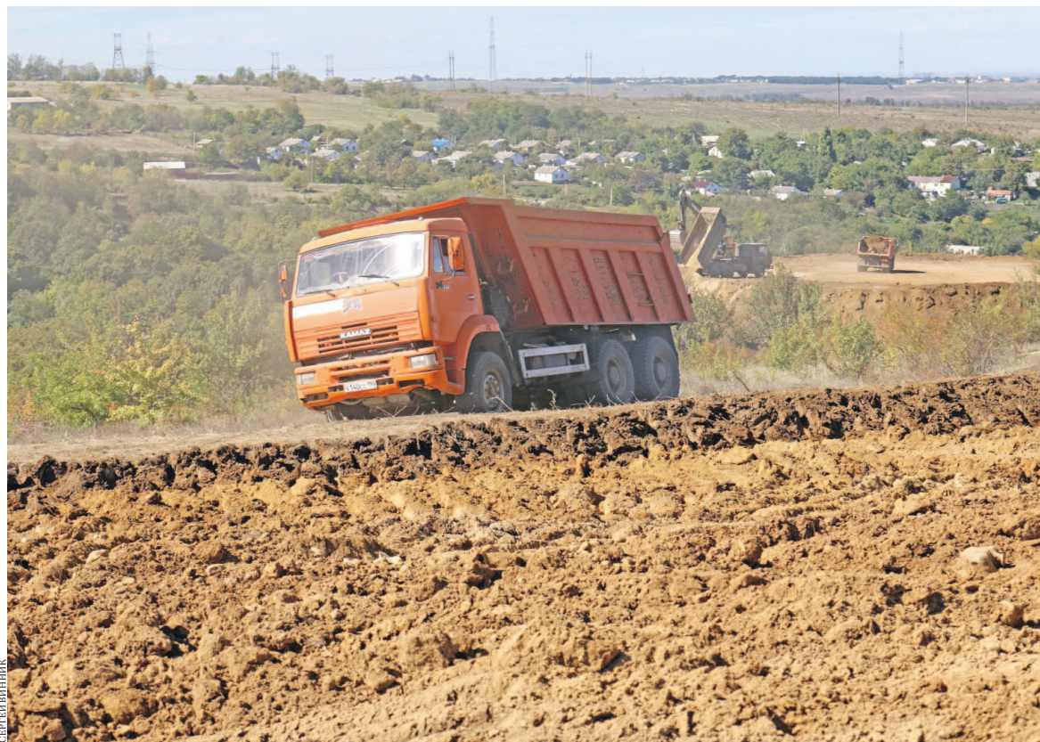
В карьере вблизи Лесноселья пока снимают верхний плодородный слой почвы.