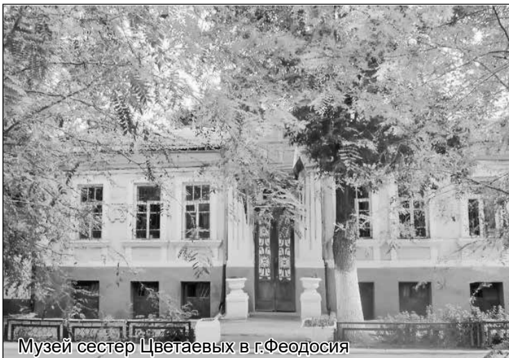
Музей сестер Цветаевых в г. Феодосия

Присоединиться к таким беседам можно каждую среду с 12.00 до 13.00 по адресу: ул. Курортная, 61.