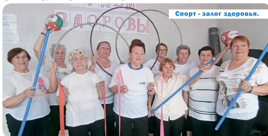
Спорт - залог здоровья.

Недавно у нас прошел первый региональный этап фестиваля граждан пожилого возраста и инвалидов в Бахчисарайском ДК. Там мы выбрали победи-