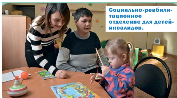
Социально-реабилитационное отделение для детей-инвалидов.

- Система социальной защиты населения помимо управленческого звена включает систему подразделений социального обслуживания. У нас это центр, шесть отделений социального обслуживания на дому, отделение срочного социального обслуживания, пять отделений дневного пребывания граждан пожилого возраста и инвалидов и социально-реабилитационное отделение для детей-инвалидов.