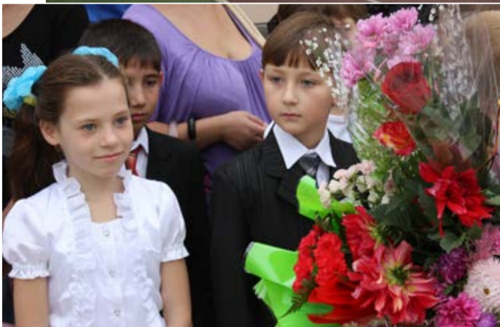
ШКОЛА ЧЕТЫРЁХ УКРАИНСКИХ И ОДНОГО РОССИЙСКОГО ПРЕЗИДЕНТОВ.